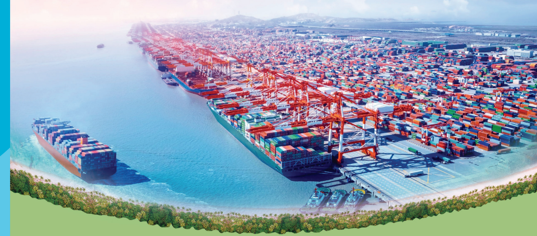
రామాయపట్నం మెగా ఇండస్ట్రియల్ హబ్